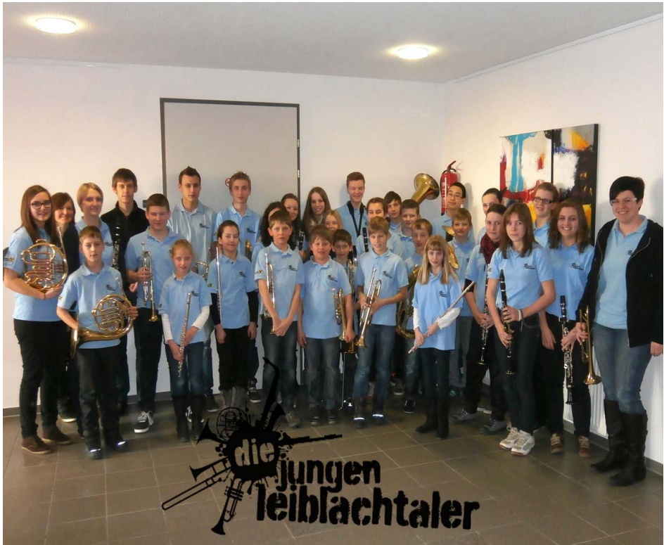
Die jungen Leiblachtaler beim Konzert in Eichenberg