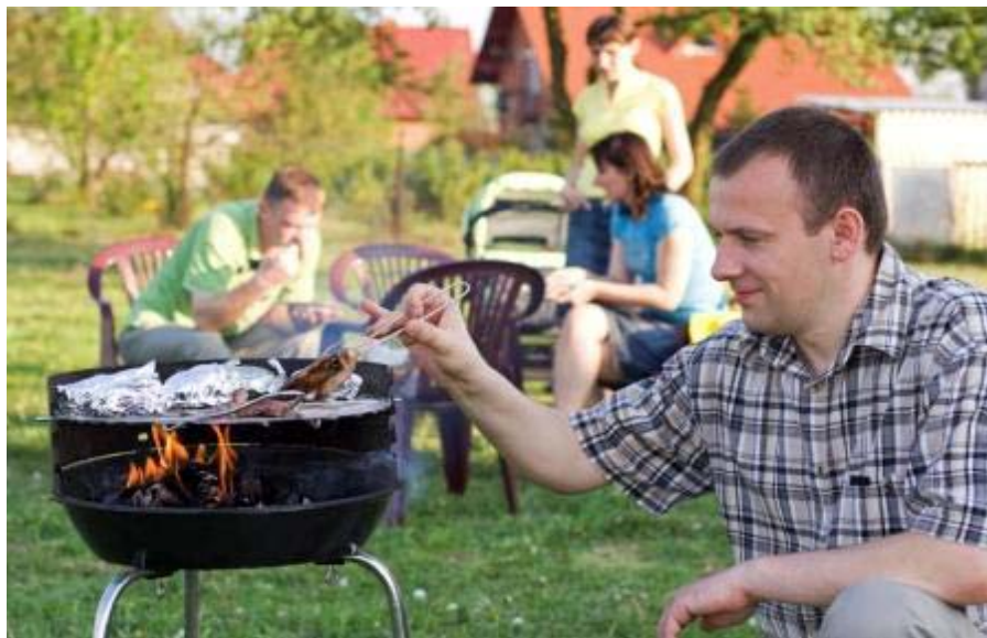
Bild: Der Grill ist meist fest in Männerhand.