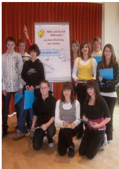
Interessierte Seminarteilnehmer aus der 4.c Klasse der HS Hörbranz.